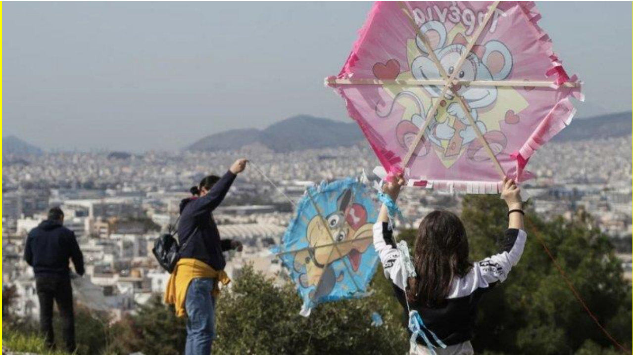
Μία διαφορετική Καθαρά Δευτέρα