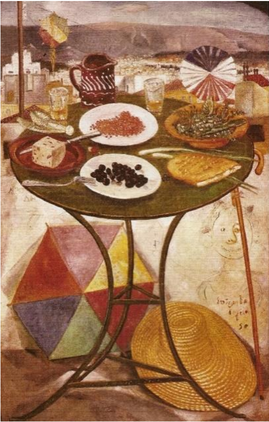
Κούλουμα (1950) του Σπύρου Βασιλείου (1902-1985)